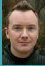
필 한센(PHIL HANSEN)

약속을 통해 더 나은 세상을 만들기 위한 비영리 캠페인인 “Because I said I would”의 창시자인 쉰은 아버지를 잃은 후 “약속의 카드”를 전세계 사람들에게 무상으로 제공하기 시작했으며 2년 동안 전세계 82개국에 250,000개의 카드를 보냈습니다. 이 카드에 적힌 약속들은 뉴스의 헤드라인을 장식해왔습니다. 쉰 또한 자신과의 약속을 지키기 위해 10일 동안 240마일을 걸으며 오하이오주를 횡단하기도 했습니다.