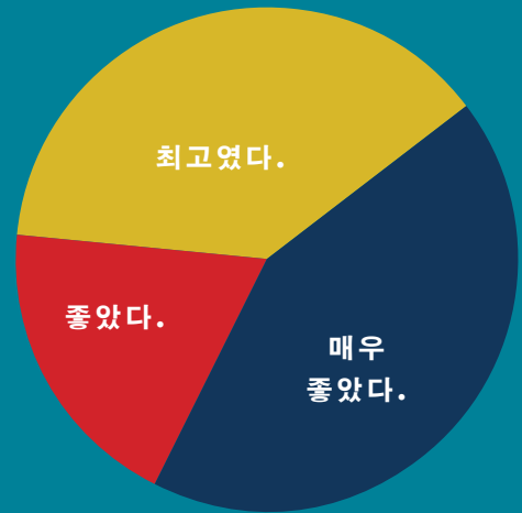
말레이시아 쿠알라룸푸르에서 열린 2014 MDRT 경험회에 대한 참가자들의 소감

전세계 MDRT 회원들이 개발한 다양한 콘텐츠와 함께하는 MDRT 경험회는 MDRT만의 방식으로 당신의 비즈니스를 업그레이드할 수 있도록 도와줍니다. 주 강연을 통해 새로운 아이디어와 영감을 얻고 워크숍에서는 각종 모범사례가 소개되며 커넥션 존(ConneXion Zone®)에서는 MDRT를 경험해볼 수 있습니다. MDRT 경험회와 글로벌 컨퍼런스는 전세계 최고의 재정전문가들이 참가하는 포럼으로 유익한 정보와 다채로운 경험을 제공합니다.