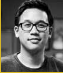
알렉스 쉰(ALEX SHEEN)

약속을 통해 더 나은 세상을 만들기 위한 비영리 캠페인인 “Because I said I would”의 창시자인 쉰은 아버지를 잃은 후 “약속의 카드”를 전세계 사람들에게 무상으로 제공하기 시작했으며 2년 동안 전세계 82개국에 250,000개의 카드를 보냈습니다. 이 카드에 적힌 약속들은 뉴스의 헤드라인을 장식해왔습니다. 쉰 또한 자신과의 약속을 지키기 위해 10일 동안 240마일을 걸으며 오하이오주를 횡단하기도 했습니다.